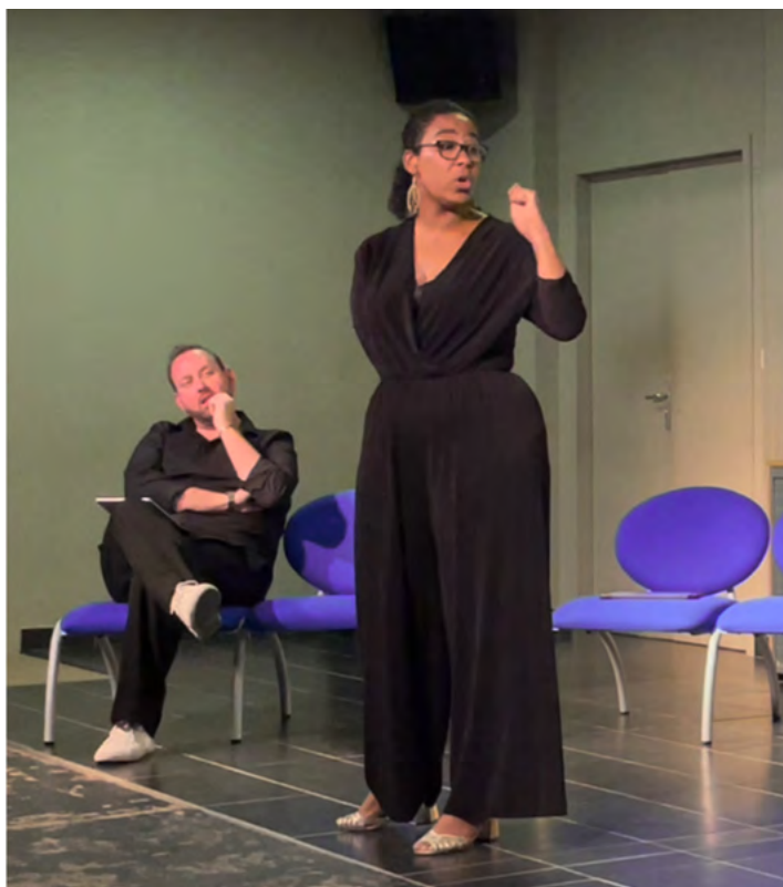
Photo sortie de résidence, Vaison-la-Romaine

une chanteuse et un chanteur lyrique, un pianiste tout 3 aussi comédiens, qui chantent donc et qui échangent lors de dialogues ciselés, souvent drôles et touchants, parfois grinçants. On rit d'un bon mot (« Ne prenez pas mon plexus pour un trampoline ! »), d'une formule classique recyclée new âge (« Je suis votre cartographe du territoire pulsionnel »), mais on est ému aussi, parce que le chant opère, toujours, comme une mise à nu.