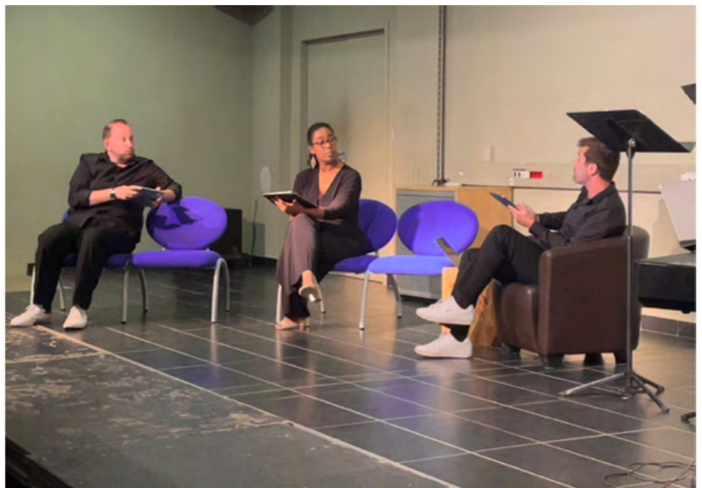
Photo sortie de résidence, Vaison-la-Romaine